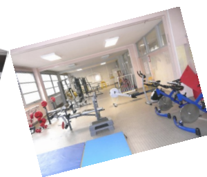
Salle de musculation