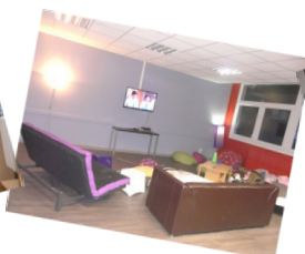
Foyer des internes